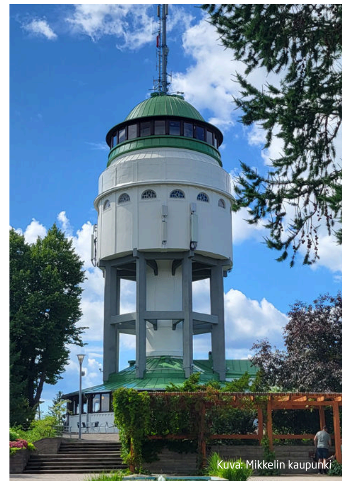
Kuva: Mikkelin kaupunki